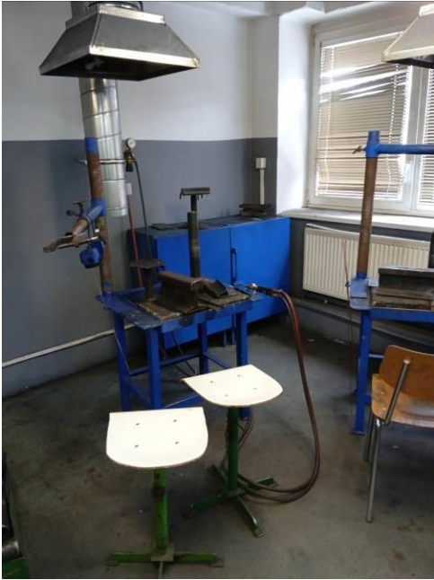
2.40 – Svařovna