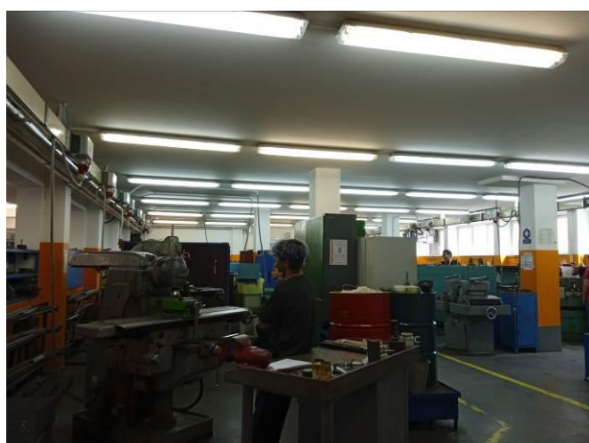
1.15 – Soustružnická dílna