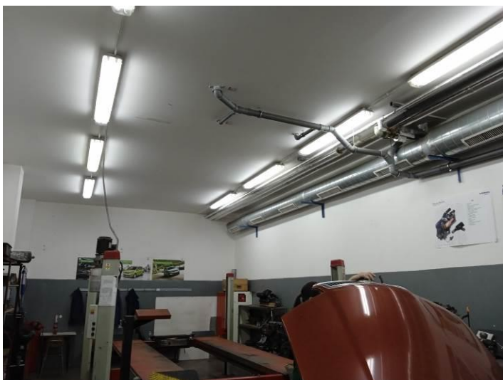
1.02 – Autodílna