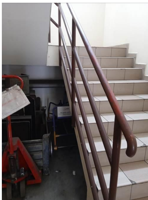
1.20 – Schodiště