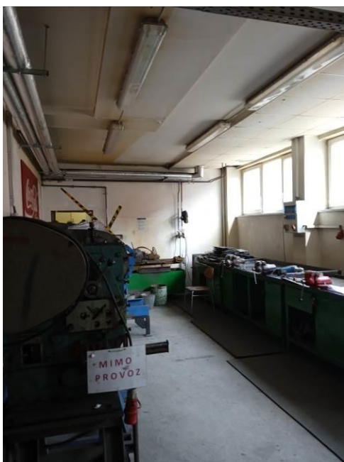
1.25 – Příprava svařovny