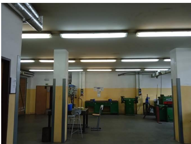
1.18 – Zámečnická dílna