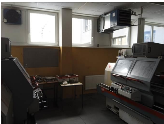
1.13 – Dílna CNC strojů