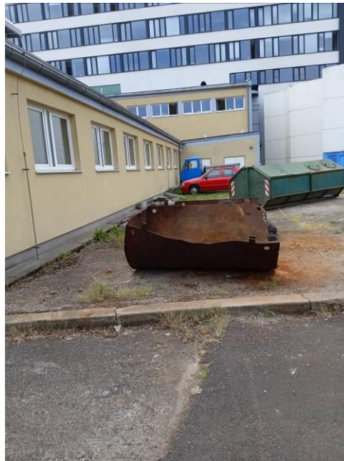
SO 703 – venkovní prostor