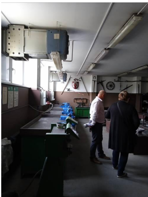
1.24 – Kovárna