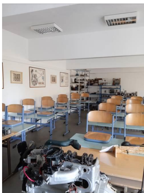
2.20 – Učebna